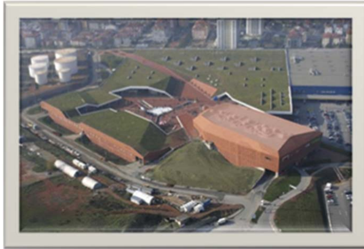
Resim: İstanbul Meydan Alışveriş Merkezi

tonluk karbondioksitin doğaya verilmesini önüyor. Binanın çim çatısı da, yalıtım sağlıyor ve yeşil alan miktarını artırıyor.